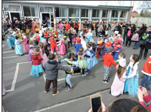
don bien joyeux dans la cour de l'école.