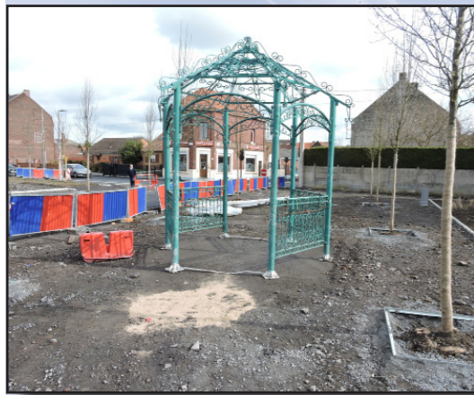
Dans le cadre de la restructuration du centre-ville, la « Gloriette » a déménagé le lundi 13 mars dernier de la place Domisse et trouvé un nouvel emplacement place Fogt.