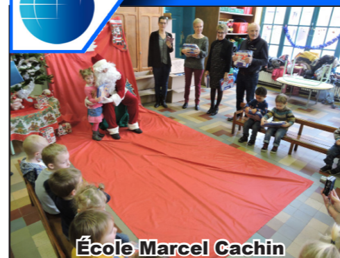
École Marcel Cachin