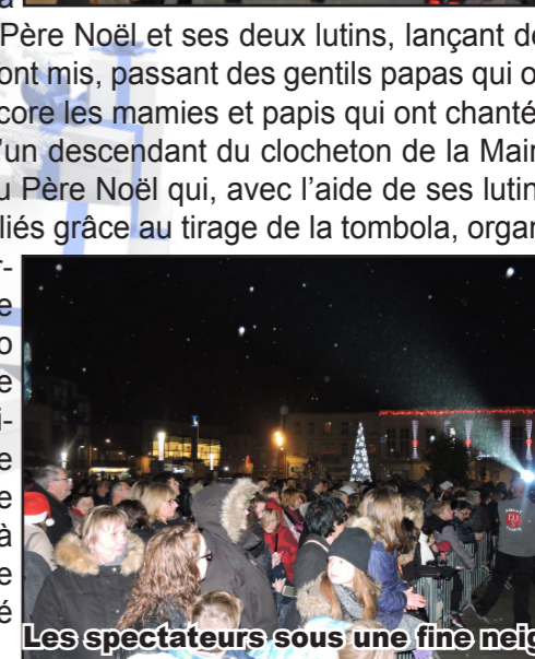
Les spectateurs sous une fine neige