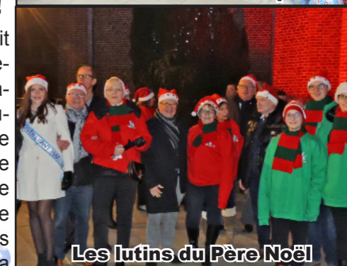
Les lutins du Père Noël