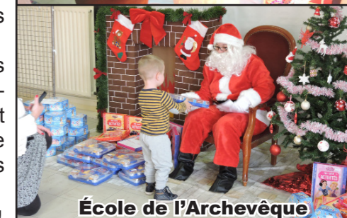
École de l'Archevêque