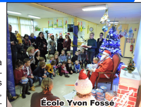
École Yvon Fossé

sée par l'Union des Commerçants et Artisans Anichois et la Ville, qui a permis de remporter les 4 téléviseurs et la Twingo mis en jeu. Même la neige s'est invitée à la fête pour que le rêve devienne réalité... Un grand merci à tous les acteurs de cette fabuleuse journée qui s'est terminée par un bon chocolat chaud tant mérité à la salle Claudine-Normand où une prise de photos avec le Père Noël a enchanté les plus petits.