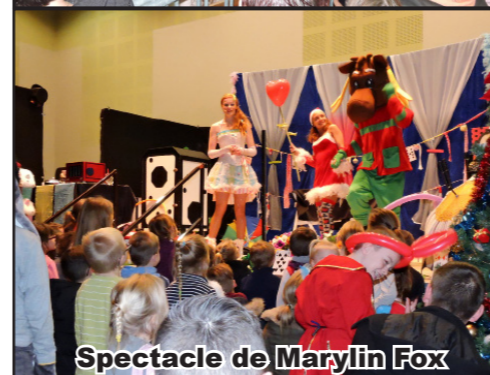
Spectacle de Marilyn Fox