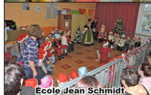
École Jean Schmidt