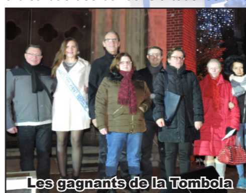
Les gagnants de la Tombola