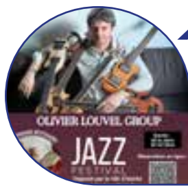
Page 11 Jazz Festival