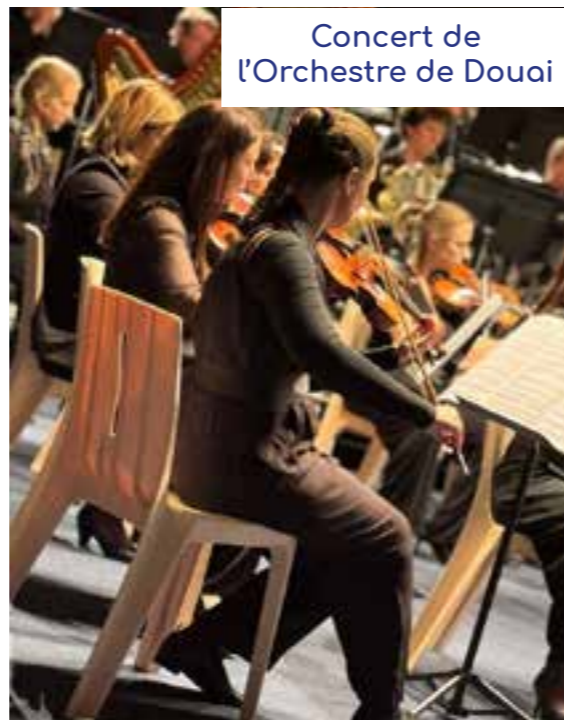
Concert de l'Orchestre de Douai