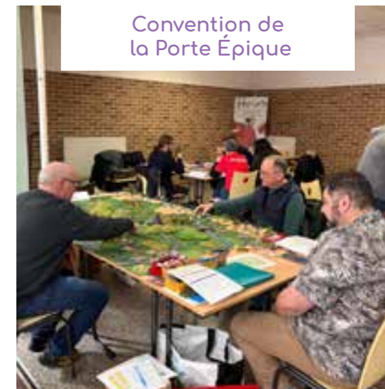
Convention de la Porte Épique