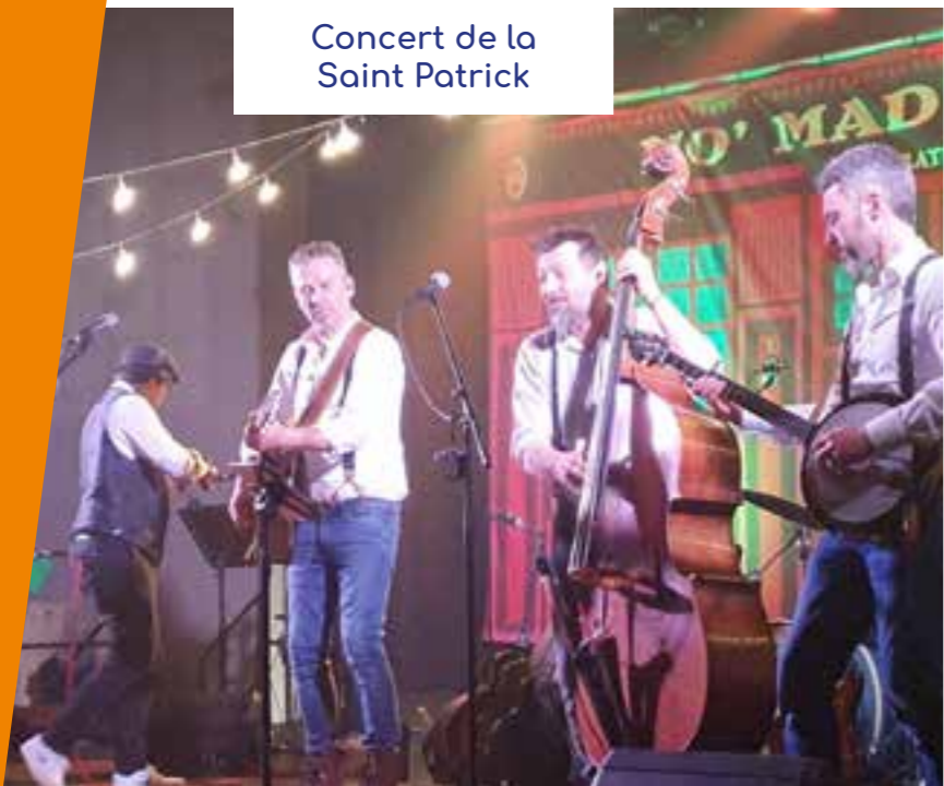
Concert de la Saint Patrick