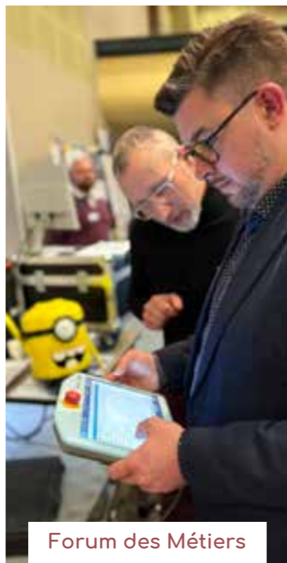
Forum des Métiers