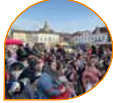
Pages 6-7 Retour en images