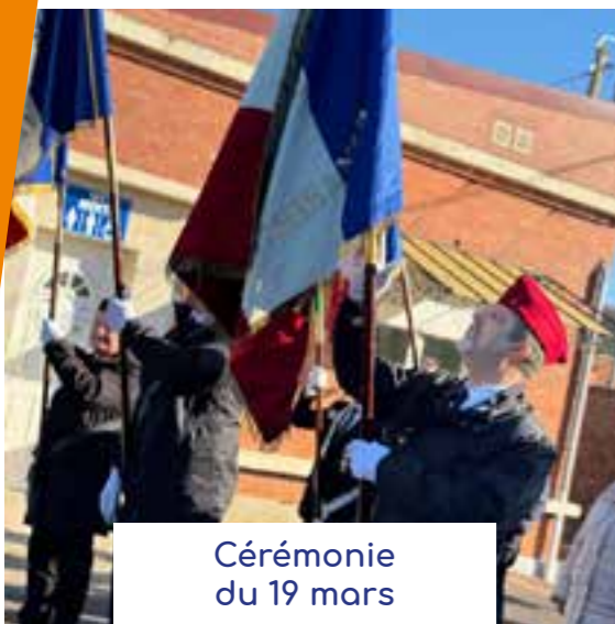
Cérémonie du 19 mars