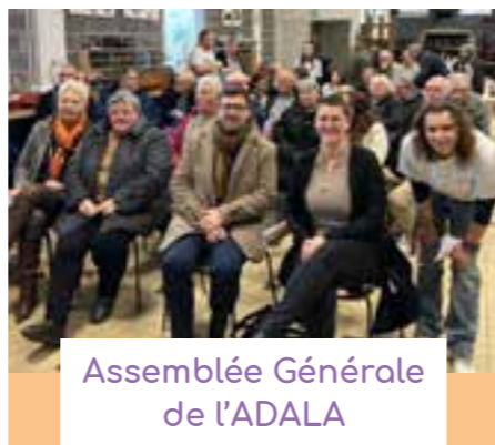
Assemblée Générale de l'ADALA