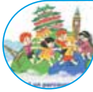
Page 8 Le Printemps de la Petite Enfance