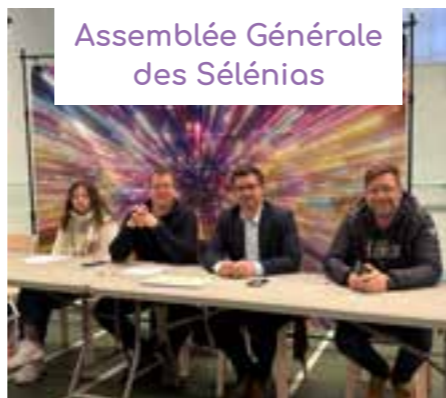
Assemblée Générale des Séléniés