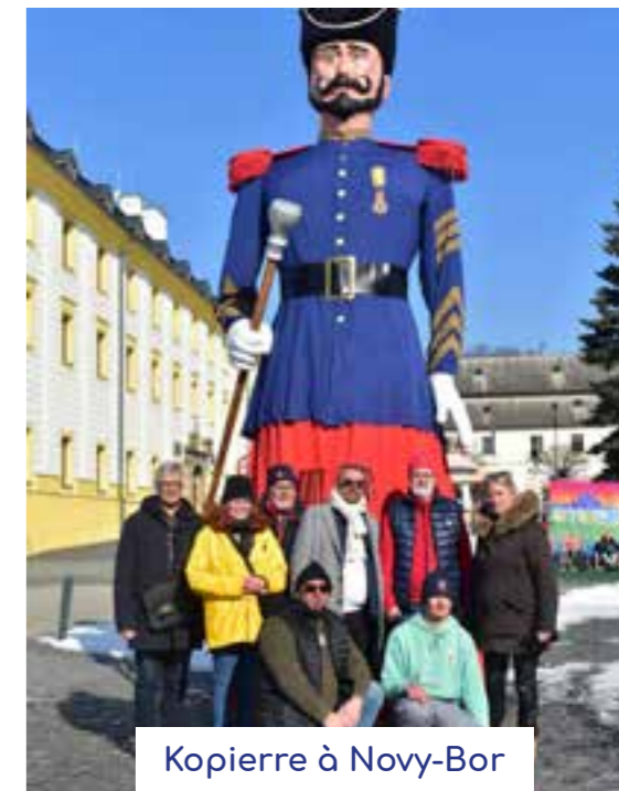
Kopierre à Novy-Bor