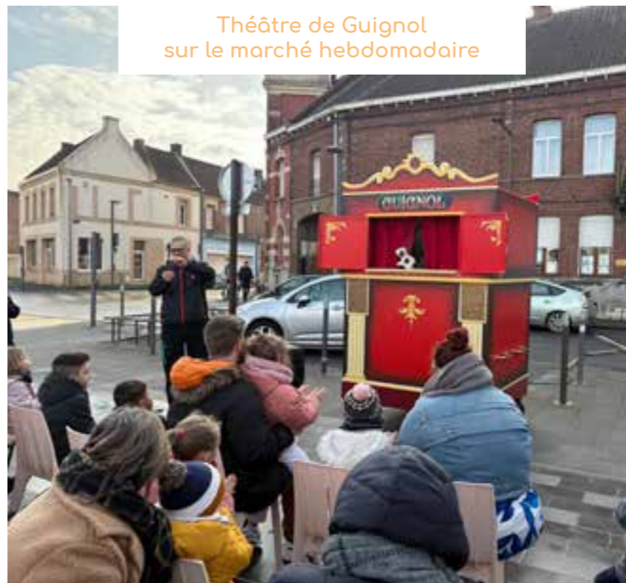
Théâtre de Guignol sur le marché hebdomadaire