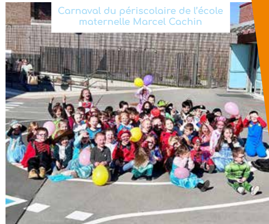
Carnaval du périscolaire de l'école maternelle Marcel Cachin