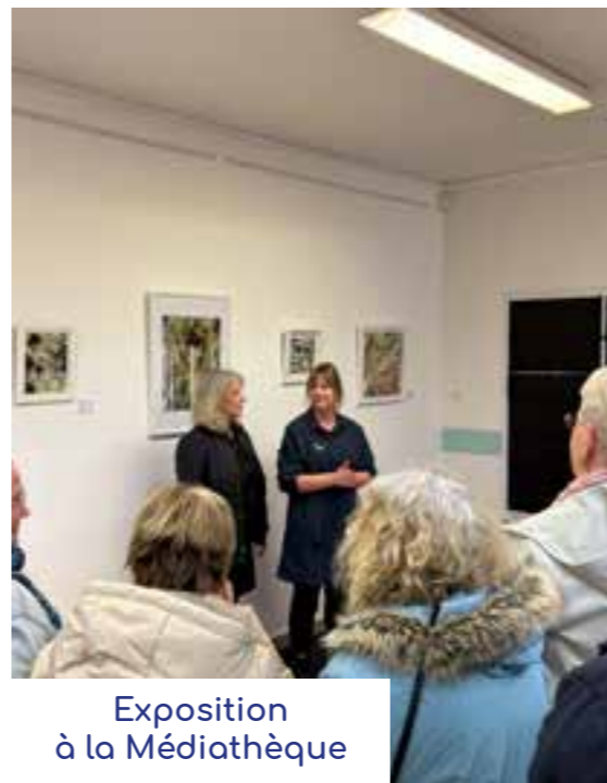
Exposition à la Médiathèque