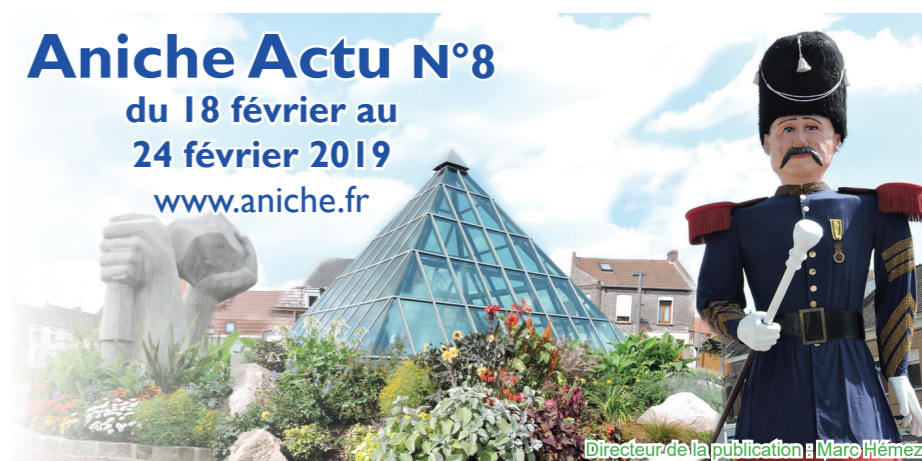
Directeur de la publication : Marc Hémez