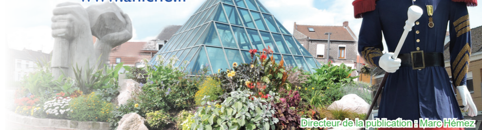
Directeur de la publication : Marc Hémez