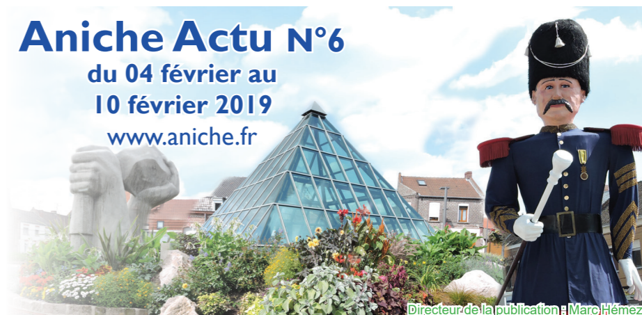
Directeur de la publication : Marc Hémez