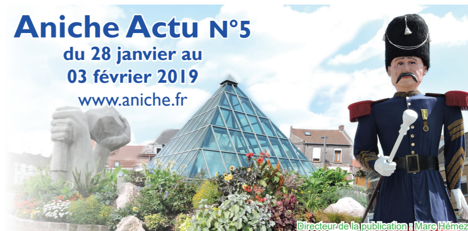
Directeur de la publication : Marc Hémez