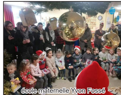
école maternelle Yvon Fossé