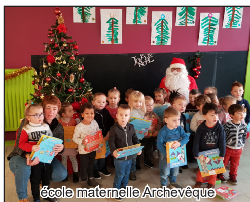
école maternelle Archevêque