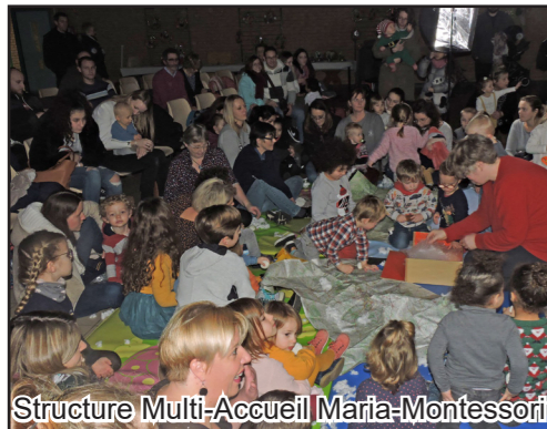
Structure Multi-Accueil Maria-Montessori

Un bel après-midi autour duquel les enfants, parents et assistantes maternelles ont pu profiter d'un goûter spécial. Ce fut aussi l'occasion de se retrouver autour d'une activité manuelle sur le thème de Noël.