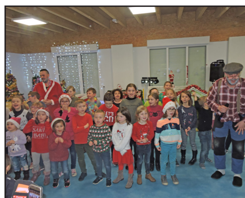
Père Noël et ses lutins commencent la distribution de friandises.

Après ces prestations copieusement applaudies par les spectateurs, les 47 apprentis comédiens et leurs parents ont partagé un buffet dînatoire avant que le Père Noël et ses lutins commencent la distribution de friandises.