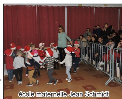
école maternelle Jean Schmidt

Avant d'entamer sa grande tournée à travers le monde, le Père Noël est passé à la Structure Multi-Accueil Maria-Montessori et dans toutes les écoles maternelles de la ville. Les élèves des écoles primaires (Quévy, Wartel et Basuyaux) et les collégiens anichois ont également reçu leurs brioche, clémentine et friandise en attendant les festivités de cette fin d'année.