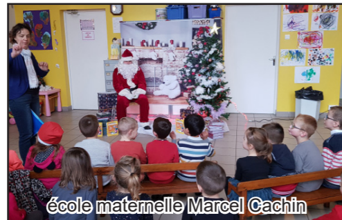
école maternelle Marcel Cachin