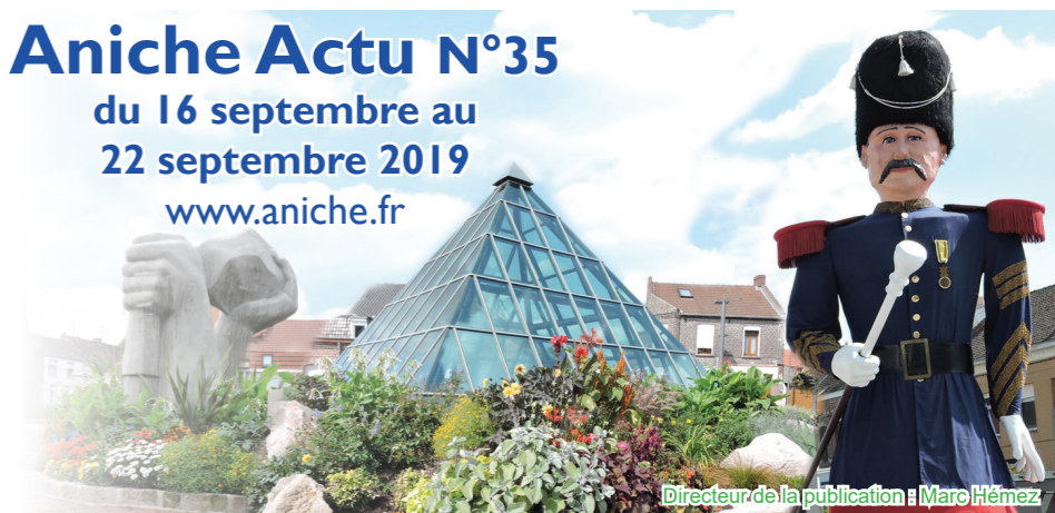
Directeur de la publication : Marc Hémez