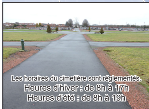
Les horaires du cimetière sont réglementés. Heures d'hiver : de 8h à 17h Heures d'été : de 8h à 19h