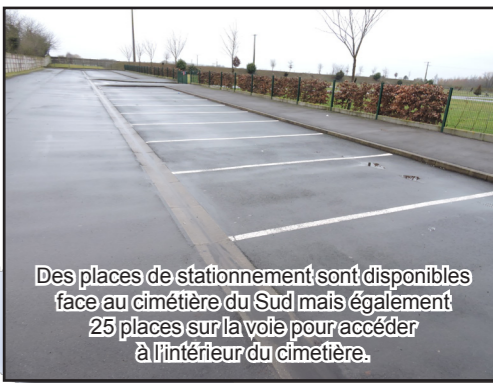
Des places de stationnement sont disponibles face au cimetière du Sud mais également 25 places sur la voie pour accéder à l'intérieur du cimetière.

Ces travaux sont en cours de réalisation. Le bâtiment aura plusieurs fonctions : il servira de loge pour le gardien avec un espace de vie : il accueillera une petite salle de réunion mais aussi des toilettes publiques aux normes pour hommes, femmes et handicapés. Enfin, les deux grosses bennes sont remplacées par huit containers mieux répartis et plus discrets.