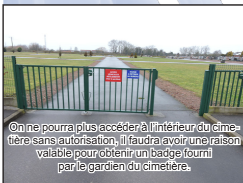
On ne pourra plus accéder à l'intérieur du cimetière sans autorisation, il faudra avoir une raison valable pour obtenir un badge, fourni par le gardien du cimetière.

auprès de qui les proches viennent se recueillir. En fin d'année dernière, les services techniques avaient démarré des travaux d'aménagement dans le pavillon à l'entrée du cimetière du Sud.