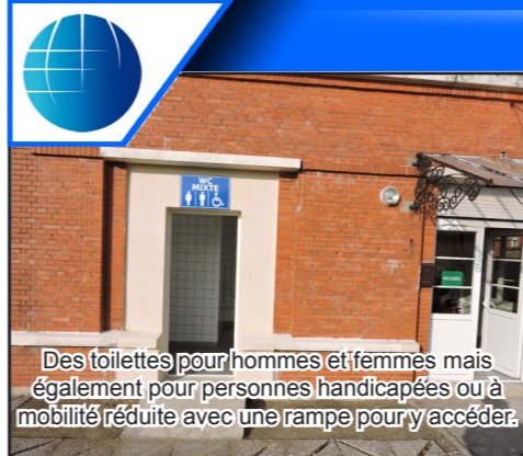
Des toilettes pour hommes et femmes mais également pour personnes handicapées ou à mobilité réduite avec une rampe pour y accéder.