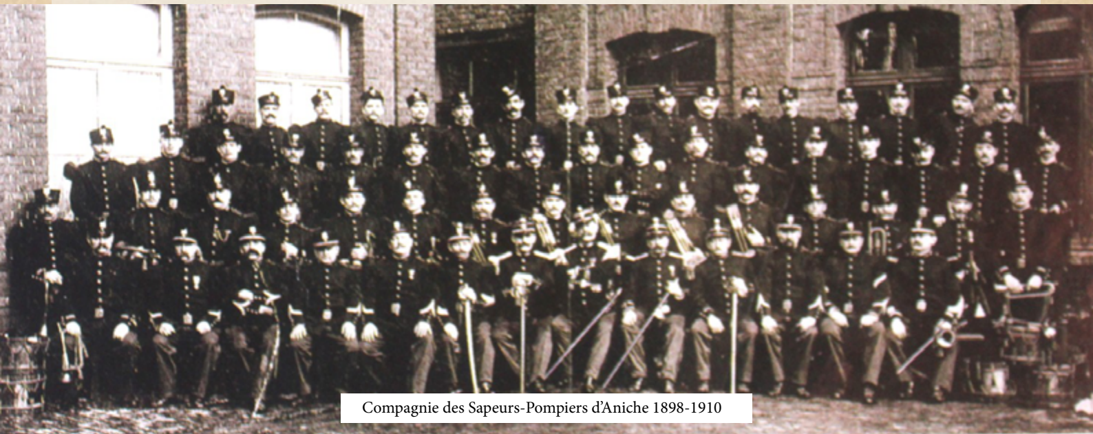
Compagnie des Sapeurs-Pompiers d'Aniche 1898-1910

Ce mois-ci nous remontons l'Histoire des sapeurs-pompiers d'Aniche...