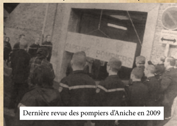
Dernière revue des pompiers d'Aniche en 2009

Ce n'est qu'à partir de 1992 qu'une unité de première intervention fut créée dans la rue Berrioz sous le mandat de Michel Meurdesoif. Elle sera cependant fermée et transférée en 2009 au Centre Départemental d'Intervention de Somain qui permettra aux Anichoïse de disposer d'une nouvelle caserne ultra moderne.